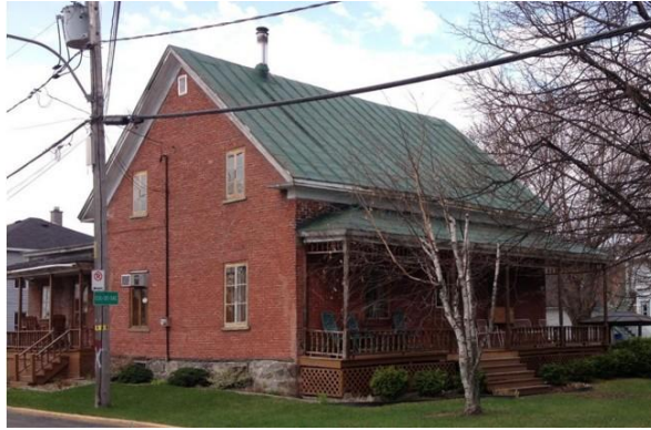
1940-1944 rue Edmond-Guillet, Marieville