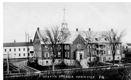
Hôpital, orphelinat, hospice

La paroisse s'étant considérablement développée grâce à toutes ses fondations, on doit en restreindre les limites. C'est alors que surgit Sainte-Angèle-de-Monnoir dans la partie la plus éloignée du centre. Monsieur Crevier y est missionnaire de 1864 à 1868.