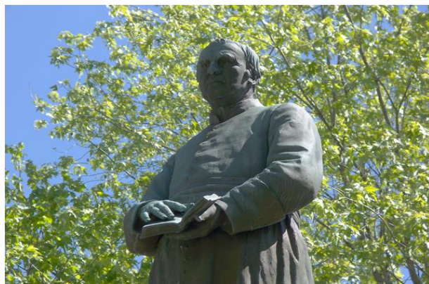
Statue de l'abbé Crevier dans le parc portant son nom