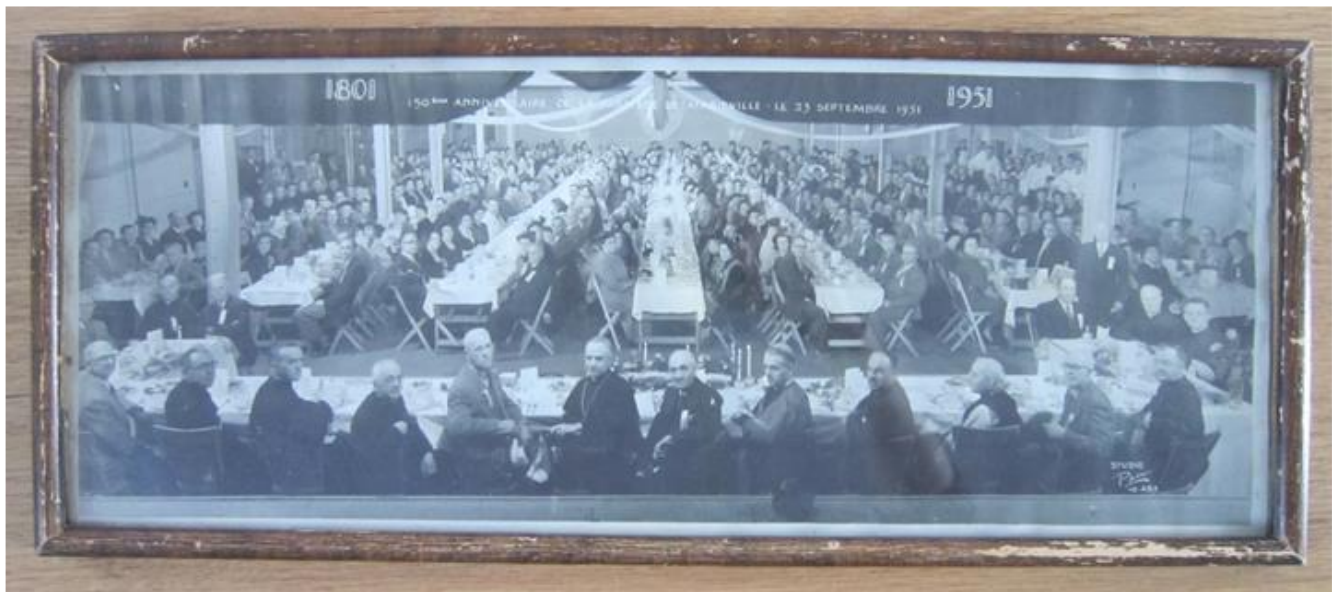
Salle au sous-sol de l'église de Mariville. Crédit photo : Studio Paul VE 4813