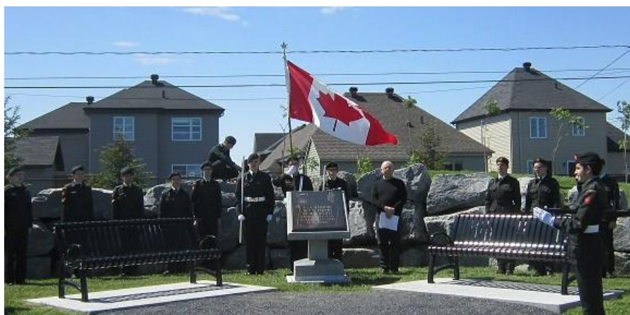
Parc des Vétérans - Hommage aux vétérans de Marieville