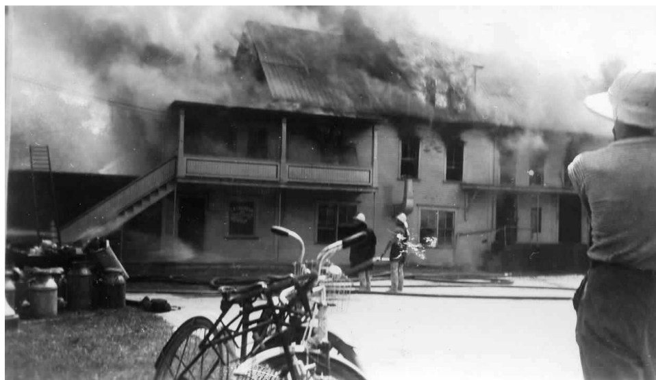
Incendie de la fromagerie et du logement, vers 1947

Cette fromagerie a été ravagée par un incendie vers 1947.