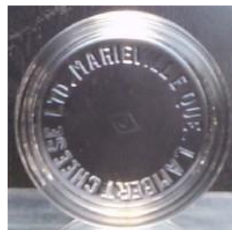
Contenants de fromage à la crème – Lambert Cheese Ltd. Marievalle, Que.