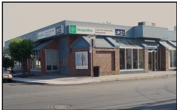
La Caisse Populaire de Marieville en 2010