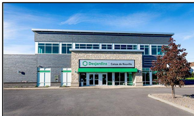
La Caisse de Rouville situé rue Ouellette à Marieville

Une organisation capable de saisir les occasions d'affaires d'offrir une qualité de services exemplaires à ses membres ; de se démarquer comme employeur de choix et en mesure de relever le défi de la productivité. Une caisse régionale « simple, humaine, moderne et performante ». Voilà ce qui est à la base de la réflexion entourant le deuxième projet de regroupement.