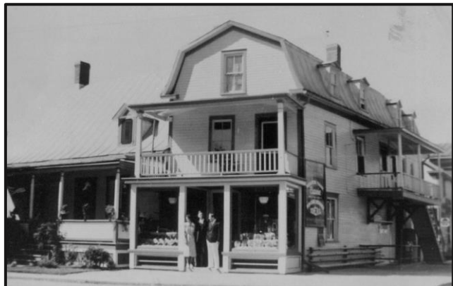
La quincaillerie Cadieux en 1929