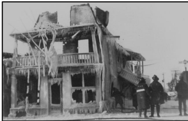
Incendie du magasin « Jos. Cadieux » le 10 février 1962