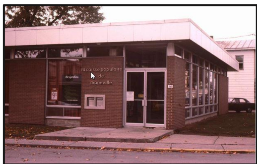
Édifice de la Caisse en 1975

Heureusement les pompiers vont empêcher que les flammes se propagent au quartier du centre-ville. Cette catastrophe met fin au commerce connu sous le nom populaire de : « Jos. Cadieux ». Celui-ci avait été au service des citoyens pendant plus de 74 ans (1888-1962).